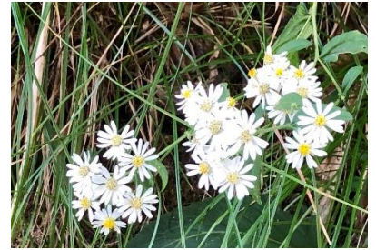
シロヨメナ（白嫁菜）

〒916-0293 越前町江波 50-80-1 宮崎コミュニティセンター内 宮崎地域コミュニティ事務局 TEL 0778-32-7710 FAX 0778-32-3246 E-mail m-community@miyazaki-area-c.net