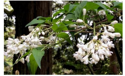
ミツバウツギ（三葉空木）

〒916-0293 越前町江波 50-80-1 宮崎コミュニティセンター内 宮崎地域コミュニティ事務局 TEL 0778-32-7710 FAX 0778-32-3246 E-mail m-community@miyazaki-area-c.net