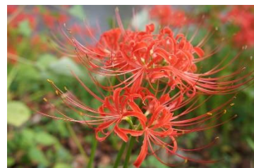
ヒガンバナ(彼岸花)

〒916-0293 越前町江波 50-80-1 宮崎コミュニティセンター内 宮崎地域コミュニティ事務局 TEL 0778-32-7710 FAX 0778-32-3246 E-mail m-community@miyazaki-area-c.net