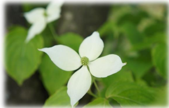
ヤマボウシ（山法師）

〒916-0293 越前町江波 50-80-1 宮崎コミュニティセンター内 宮崎地域コミュニティ事務局 TEL 0778-32-7710 FAX 0778-32-3246