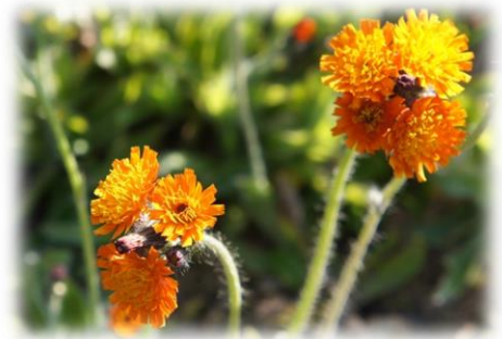
コウリントンポポ（紅輪蒲公英） 5月18日撮影 江波

〒916-0293 越前町江波 50-80-1 宮崎コミュニティセンター内 宮崎地域コミュニティ事務局 TEL 0778-32-7710 FAX 0778-32-3246 E-mail m-community@miyazaki-area-c.net