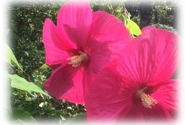
アメリカフヨウ (アメリカ芙蓉) 7月25日撮影 小曾原

〒916-0293 越前町江波 50-80-1 宮崎コミュニティセンター内 宮崎地域コミュニティ事務局 TEL 0778-32-7710 FAX 0778-32-3246 E-mail m-community@miyazaki-area-c.net