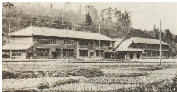
昭和 30 年代の宮崎小学校