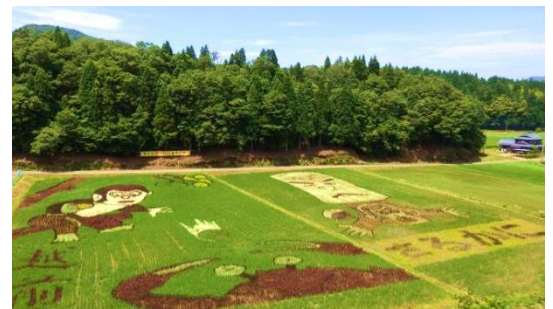
昨年の檜津田んぼアート