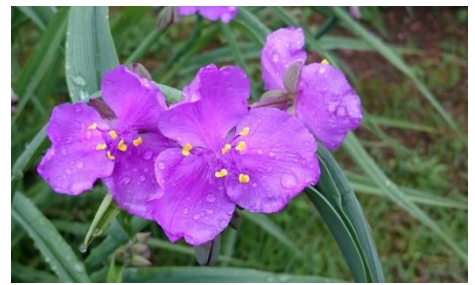
ムラサキツククサ（紫露草）5月25日撮影

〒916-0293 越前町江波 50-80-1 宮崎コミュニティセンター内 宮崎地域コミュニティ事務局 TEL 0778-32-7710 FAX 0778-32-3246 E-mail m-community@miyazaki-area-c.net